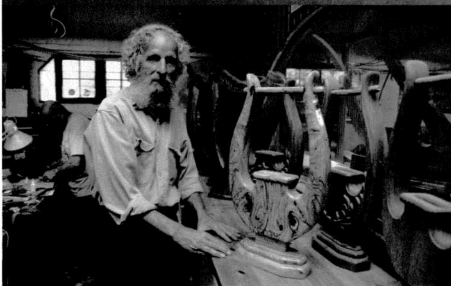
לפי הרגש. "הכלי מנגן את מה שאתה מרגיש"

לאחר שנה וחצי של חיים בישראל, הקימו את בית המלאכה לנבלים בחוף הכנרת הסמוך למושב מגדל אלא שאיש לא הגיע אליהם ופרנסה לא הייתה להם. כתבה אחת שהתפרסמה ביומן האנגלי "ג'רוזלם פוסט" בעקבות פגישה אקראית בינם לבין כתבת העיתון, הביאה לבית המלאכה עיתונאים נוספים כולל מתחנות זרות. הם הכינו כתבות על בני הזוג הררי שהתפרסמו בכל העולם. הקליינטים החלו להגיע.