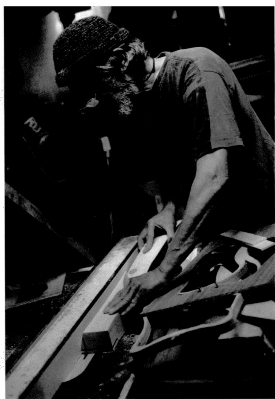
את הדיקט המעוגל ממלאים בחתיכות עץ

"לכלי שאני מחזיק בידי יש 22 מיתרים, כל מיתר הוא כנגד אות באותיות הא-ב. אני יכול לנגן לך מילים שונות כמו 'לב', 'אהבת אלוקים', 'תורה ומצוות' ו'קדושה'"