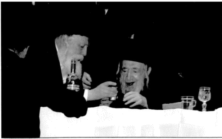
שמחה בכבוד שמיים. עם כ"ק מרן האדמו"ר מגור