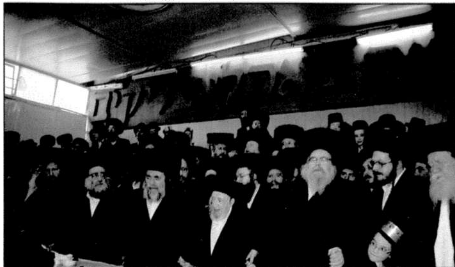
עד זיקנה ושיבה חנן פני זקן כנער. בשמחה בבית בעלזא

כל ימיו השתדל הגה"צ גאב"ד נאראל להסתיר את