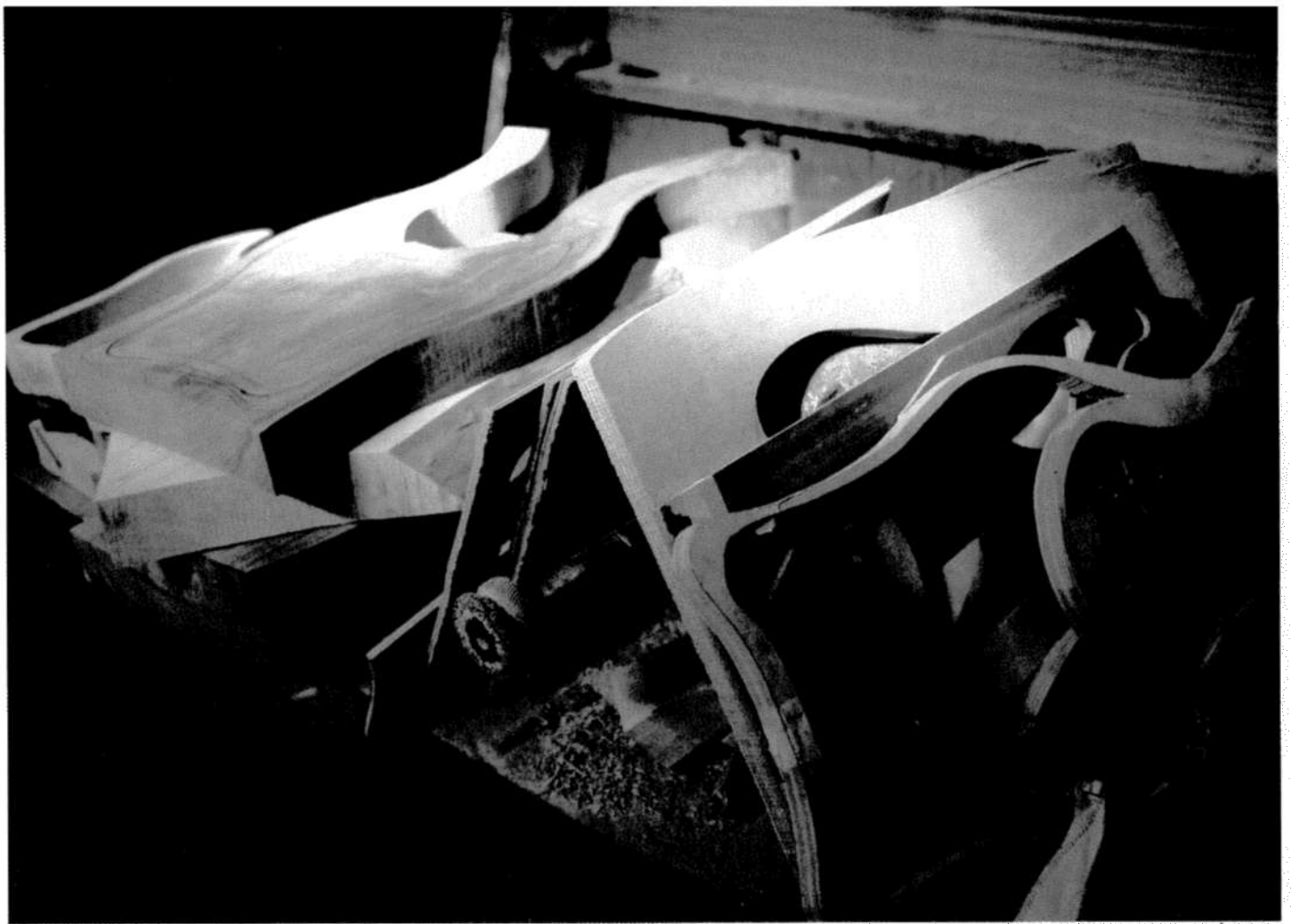
"שבלונה מיוחדת מקבלת את כל החתיכות"

"כאשר עגנה האונייה בצרפת, הצטרף לנסיעה זו כ"ק האדמו"ר האמרי חיים' מו'ז'ניץ צוק"ל. לאחר שהתברכו לשלום התעניין לדעת שלומי של בן אחיו של מרן זי"ע (לימים נכדו, הלא הוא כ"ק האדמו"ר מבעלזא שליט"א), וחפץ היה לדעת אם הכתירוהו כבר בכתר האדמו"רות.